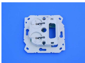
Module de base 125.0100